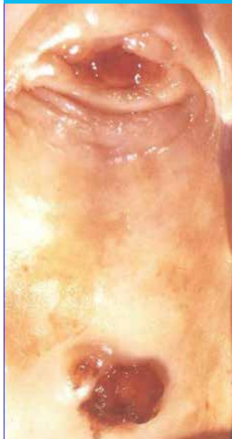
Figure 2 : Col hypoplasique (en haut) et adénocarcinome à cellules claires du vagin