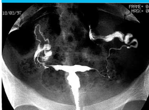
Figure 6 : utérus en T avec bords irréguliers et rétrécissements du corps