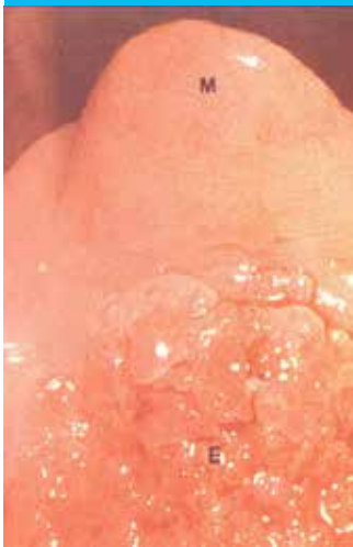
Figure 1 : Col avec saillie antérieure en "casquette d'aviateur" et adénose.