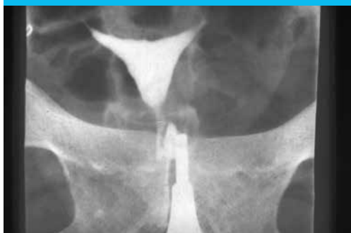
Figure 4 : utérus normal